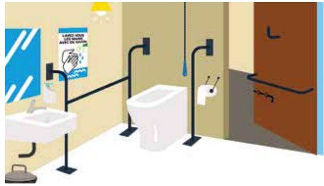
Figure 4 : Exemple de l'intérieur d'une cabine de toilette adaptée aux femmes et aux filles et accessible aux personnes à mobilité réduite.