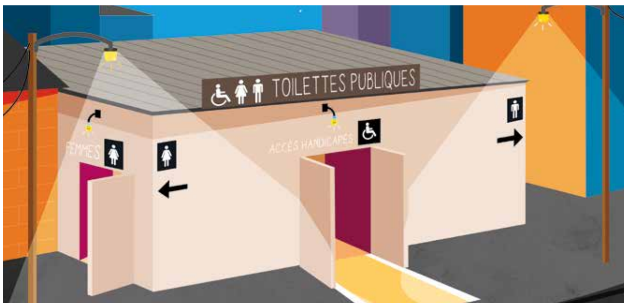
Figure 1 : Exemple de l'extérieur d'un bâtiment sanitaire adapté aux femmes et aux filles.

Des toilettes publiques et communautaires adaptées aux femmes et aux filles : guide à l'intention des urbanistes et des décideurs s'adresse aux autorités locales, aux urbanistes, ainsi qu'à toute autre personne responsable de la prestation de services d'assainissement. Ce guide les aidera à mieux appréhender les besoins des femmes et des filles en matière de toilettes publiques et communautaires. Il peut les accompagner afin de mieux répondre à ces besoins et apporter des conseils pratiques pour la planification, la mise en œuvre et l'opération. Cette note d'information souligne les éléments marquants du guide et donne un aperçu de la problématique de l'adaptation des toilettes au public féminin.