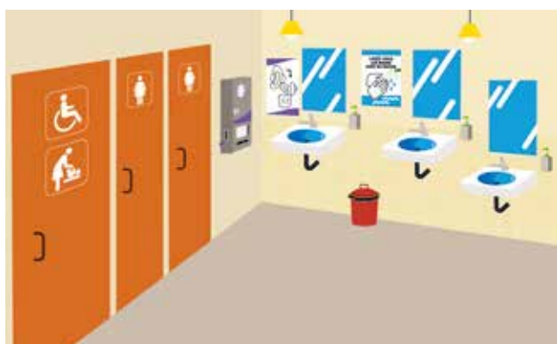
Figure 2 : Exemple de l'intérieur d'un bâtiment sanitaire adapté aux femmes et aux filles.